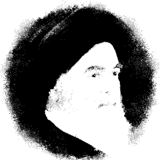
الشيخ الشيخ الأجل آية الله العظمى الإمام السيد محمد الحسيني الشيرازي دام ظلّه الوارف